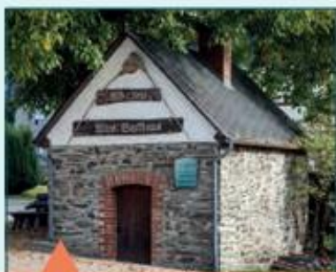
Historisches Backhaus „Backes“

Neben den geschichtlichen Aspekten eröffnet die Wanderung auf einem Höhenweg oberhalb von Haag einen atemberaubenden Blick auf die höchste Erhebung in Rheinland-Pfalz, den 816 m hohen Erbeskopf sowie den Nationalpark Hunsrück-Hochwald. Nach diesem beeindruckenden Panorama führt der Weg durch idyllische Wälder, vor-